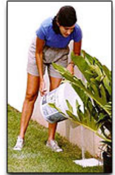
Elimine las aguas estancadas alrededor de su casa.

( www.cdc.gov/ncidod/dvbid/westnile/qa/spanish/wnv_prevention_spanish.htm ) en la página de Preguntas y Respuestas.